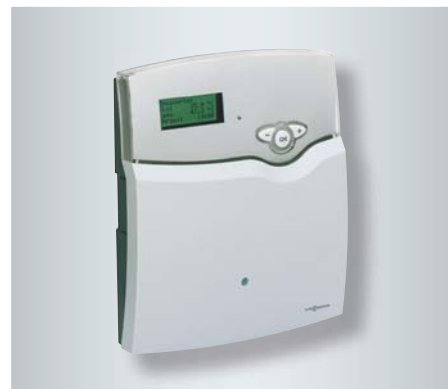
Intelligentes Energiemanagement für die Nutzung der Solarwärme

Die Vitosolic 200 sorgt dafür, dass die auf dem Dach gewonnene Wärme so effektiv wie möglich für die Trinkwassererwärmung oder Heizungsunterstützung genutzt werden kann. Die Vitosolic 200 kommuniziert mit der Heizkesselregelung und schaltet den Heizkessel ab, sobald ausreichend Sonnenwärme zur Verfügung steht und senkt somit die Heizkosten.