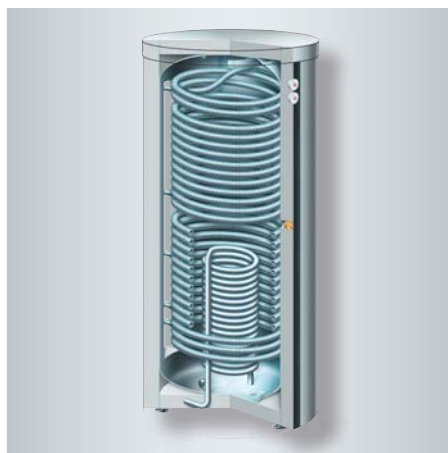
Vitocell 340-M, multivalenter Kombispeicher für hohen Warmwasserkomfort

Die Gehäuse bestehen aus einem umlaufenden Aluminiumrahmen. Die Glasabdichtung ist mit einem flexiblen, witterungs- und UV-beständigen Dichtungsmaterial nahtlos ausgeführt.