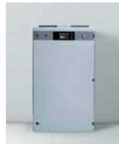
Vitobloc 200 EM-6/15 und Vitobloc 200 EM-9/20