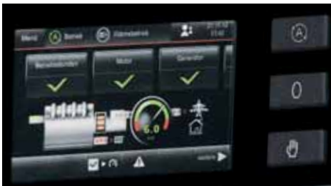
Display der Regelung