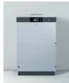
Vitobloc 200 EM-20/39