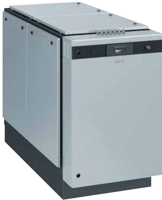
Blockheizkraftwerk Vitobloc 200 EM-20/39

Mit den Blockheizkraftwerken lassen sich Wärme und Strom besonders wirtschaftlich erzeugen.