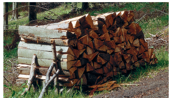
Heizen mit Holz – der natürlichste Brennstoff der Welt

Die Füllraumbreite beträgt 1080 Millimeter und bietet eine komfortable Befüllung auch mit Meterscheiten.