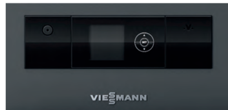
Regelung Ecotronic 100 mit beleuchtetem Display für einfache und intuitive Bedienung

Die Heizflächen lassen sich mittels Hebel komfortabel seitlich reinigen. Aufgrund der Vergasertechnik und Verbrennungsregelung mit Lambdasonde erreicht der Vitoligno 150-S einen hohen Wirkungsgrad und eine saubere, effiziente Verbrennung mit sehr niedrigen Staubwerten. Der beidseitige Türanschlag ermöglicht eine optimale Raumnutzung und Eckwandaufstellung im Aufstellraum.