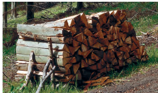
Heizen mit Holz – der natürlichste Brennstoff der Welt

Der Vitoligno 150-S arbeitet modulierend und passt sich stufenlos dem momentanen Wärmebedarf an. Die Verbrennungsregelung mit Lambdasonde und Abgastempersensoren erfasst den Sauerstoffgehalt und die Temperatur der Abgase. Sie sorgt für niedrige Emissionen und einen hohen Wirkungsgrad von bis zu 93,1 Prozent. So verwandelt der Vitoligno 150-S das Scheitholz sparsam in nutzbare Wärme.