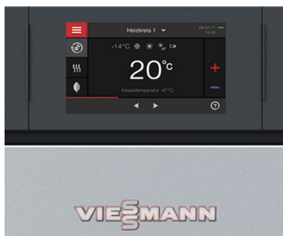
Vitotronic 200 – integrierte Regelung für Heizkessel-Units

Der Vitocrossal 200 ist ideal für Mehrfamilienhäuser und Gewerbebetriebe. Die integrierte Kaskadenfunktion ermöglicht Mehrkesselanlagen von bis zu acht Heizkesseln. Für Anlagen mit zwei Einheiten liefert Viessmann vorgefertigte Systemverrohrungen und Abgassammelführungen aus Edelstahl. Die Heizzentrale verfügt über bewährte Komponenten der Viessmann Brennwerttechnik wie die Inox-Crossal-Wärmetauscherfläche und den MatriX-Strahlungs- bzw. MatriX-Zylinderbrenner. Der Kessel kann wahlweise raumluftabhängig und -unabhängig betrieben werden.