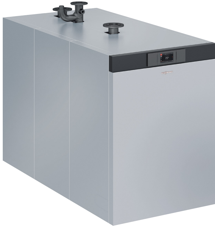
Vitocrossal 200 – Gas-Brennwertkessel mit einer Nenn-Wärmeleistung von 87 bis 311 kW

Mit einer Leistung von 87 bis 311 kW setzt der Gas-Brennwertkessel Vitocrossal 200 (Typ CM2C) Maßstäbe bei Wartung und Service. Mit dem bewährten Matrix-Strahlungsbrenner (bis 142 kW) und dem Matrix-Zylinderbrenner (ab 186 kW) wird der Betrieb mit den Gasarten H und ab 186 kW mit Flüssiggas sowie eine Modulation von bis zu 20 Prozent ermöglicht.