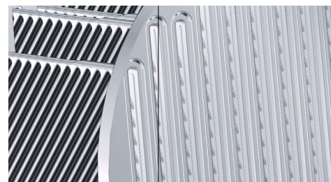
Der Inox-Radial-Wärmetauscher garantiert höchste Effizienz und eine lange Nutzungsdauer.

Die hochwirksame Wärmeübertragung und die hohe Kondensationsrate ermöglichen Norm-Nutzungsgrade bis 98 Prozent ( H_g ). Diese Werte werden durch das Gegenstromprinzip von Heizgas und Kesselwasser sowie die intensive Verwirbelung der Heizgase durch die Heizfläche erreicht.