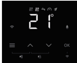
LED-Display mit 7-Segment-Anzeige und Touch-Buttons