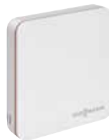
ViCare Thermostat für mehr Komfort und Effizienz

Voraussetzung unter www.viessmann.at/garantie