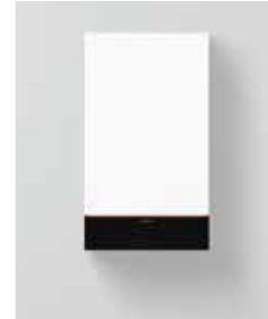
Vitodens 100-W (B1HF und B1KF)

Das Kombigerät Vitodens 100-W beinhaltet einen integrierten Durchlauferhitzer zur Warmwasserbereitung.