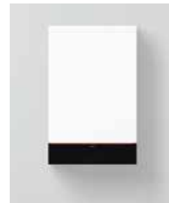
Vitodens 111-W (B1LF)

Abweichende Nenn-Wärmeleistung bei Betrieb mit Flüssiggas oder die Verwendung in Mehrfachbelegung, siehe Planungsanleitung