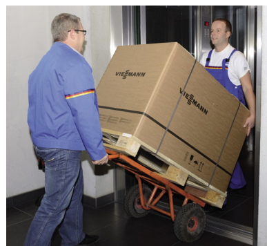
Einfacher Transport, auch in Heizzentralen auf dem Dach

Mit dem Vitodens 200-W entsteht so eine effiziente Heizungsanlage mit einem hohen Heiz- und Trinkwasserkomfort, die sich besonders zur Modernisierung bei gewerblichen Anwendungen anbietet.