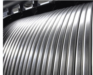
Inox-Radial-Wärmetauscher aus Edelstahl

Edelstahl macht den Unterschied. Der korrosionsbeständige Inox-Radial-Wärmetauscher aus Edelstahl ist das Herzstück des Vitodens 200-W. Er wandelt die eingesetzte Energie besonders effizient in Wärme um. Praktisch verlustfrei, mit einem kaum zu übertreffenden Wirkungsgrad von 98 Prozent. Und das mit der Sicherheit des besonders langlebigen, hochwertigen Edelstahls.