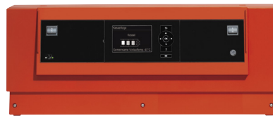
Kaskadenregelung Vitotronic 300-K

Für die Regelung der Kaskade steht die neue Vitotronic 300-K zur Verfügung. Die Klartextanzeige mit grafischer Unterstützung bietet einen hohen Bedienkomfort. Auf Wunsch kann die Heizungsanlage über Vitogate 200 auch in Gebäudeautomationsysteme eingebunden werden.