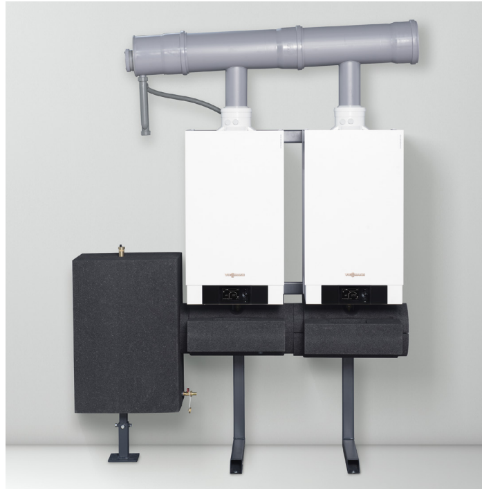
Komplett vormontierte Kaskadenmodule für die Wand oder die freistehende Montage, als Reihen- und Blockaufstellung

Das Vitodens 200-W Gas-Brennwert-Wandgerät ist für den Einsatz in Mehrfamilienhäusern, gewerblichen Bauten und öffentlichen Einrichtungen bestens geeignet. Der von Viessmann entwickelte und gefertigte Heizkessel ist in dieser Art weltweit einzigartig. Als modulares Kaskadensystem ist er nicht nur kostengünstig, er bietet auch platzsparende Lösungen. Es lassen sich Kaskaden mit einer Nenn-Wärmeleistung von zweimal 49 kW bis sechsmal 99 kW auch in niedrigen Räumen von 1,9 Meter Deckenhöhe kombinieren.