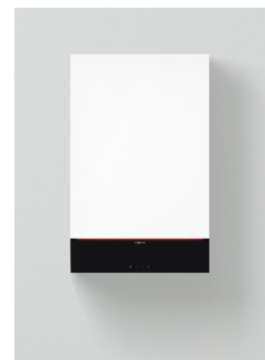
Vitodens 222-W (Typ B2LF)

Die Geräte sind für Erd- und Flüssiggas nach EN 15502 geprüft und zugelassen. Abweichende Nenn-Wärmeleistung bei Betrieb mit Flüssiggas, siehe Planungsanleitung. Warmwasser-Ausgangsleistung bei Trinkwassererwärmung von 10 auf 45 °C.