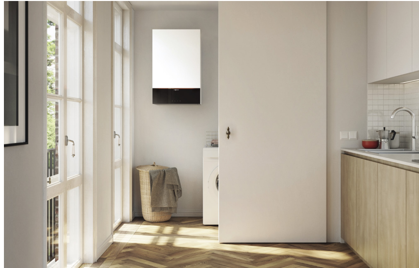
Vitodens 222-W mit attraktivem Design in der Farbe Vitopearlwhite

Das Gas-Brennwert-Kompaktgerät Vitodens 222-W ist eine intelligente Energiezentrale, die hohe Ansprüche an eine komfortable Wärme- und Trinkwasserversorgung erfüllt. Mit modernem, funktionalem Design sowie klar gestalteten, matten Oberflächen fügt es sich harmonisch in jedes Wohnambiente ein.