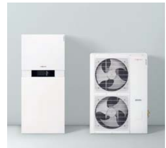
Inneneinheit Vitocaldens 222-F (links) mit Außeneinheiten (Weiß)