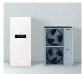
Inneneinheit Vitocaldens 222-F (links) mit Außeneinheit (Vitosilber)