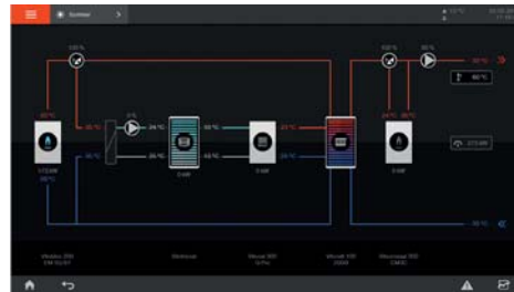
Übersichtliche Darstellung aller Anlagenkomponenten auf einen Blick