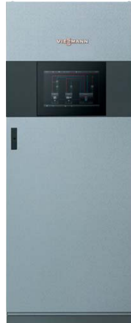
Vitocontrol 200-M Standgehäuse

Vitocontrol 200-M ist eine modulare, leistungsstarke Systemsteuerung mit betreiberorientierter, grafischer Bedienoberfläche. Darüber hinaus stellt sie alle Leistungs- und Verbrauchsdaten eines Energiesystems dar und lässt sich kundenspezifisch anpassen.