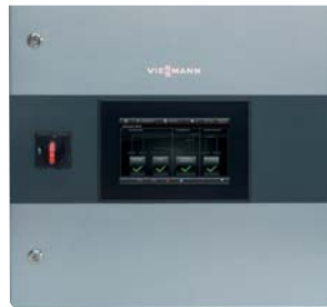
Vitocontrol 200-M Wandgehäuse