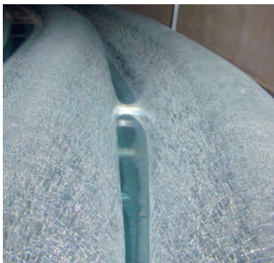
Eisbildung um den Wärmeübertrager im Eis-Energiespeicher

Besonders innovativ ist die Nutzung eines Eis-Energiespeichers als Energiequelle. Dabei handelt es sich um eine Zisterne mit eingebauten Wärmetauschern, die im Garten vergraben und mit normalem Leitungswasser befüllt wird. Im Garten wird an der Oberfläche ein Energiezaun aus Aluminium-Solar-Luftabsorbern angebracht, der Wärme aus der Umgebungsluft sowie aus der solaren Einstrahlung sammelt und diese der Wärmepumpe oder dem Speicher zuführt. Darüber hinaus bezieht der Eis-Energiespeicher Wärme direkt aus dem Erdreich.