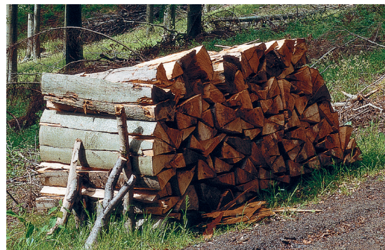
Heizen mit Scheitholz

Für einen hohen Heizkomfort kann das Zünden des Brennstoffes auch mittels einer optional erhältlichen automatischen Zündung mit einer Leistungsaufnahme von lediglich 300 W erfolgen. Auch kann der Kessel bereits mit Scheitholz wieder gefüllt werden, wenn noch keine Wärmeanforderung anliegt. Sobald die Temperatur des Heizwasser-Pufferspeichers für das Heizen oder die Warmwasserbereitung nicht mehr ausreicht, zündet der Kessel automatisch. Durch die geringe Leistungsaufnahme ist die Zündung besonders effizient.