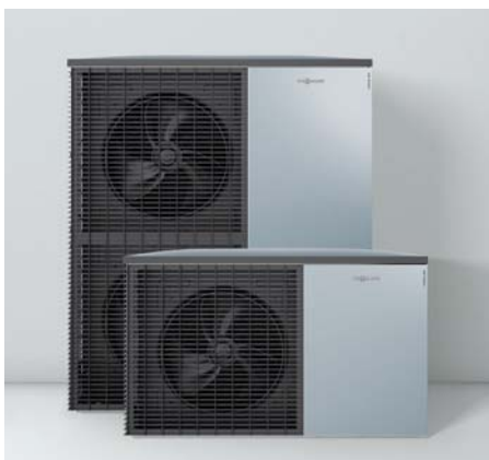
Neue Außeneinheiten im Viessmann Design – Made in Germany