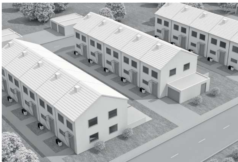
Besonders leiser Betrieb, ideal zum Einsatz in Reihenhaussiedlungen

Über die Regelung Vitotronic 200 können die Wärmepumpen per Internet-Schnittstelle Vitoconnect (Zubehör) und die kostenlose ViCare App von überallher gesteuert werden. Außerdem ist die Kombination mit zentralen Wohnungslüftungsgeräten Vitovent möglich.