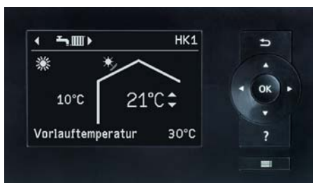
Display der Regelung Vitotronic 200