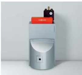
Vitorondens 200-T (20,2 bis 53,7 kW)