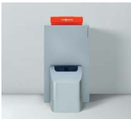
Vitorondens 200-T (67,6 bis 107,3 kW)