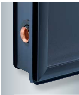
Kollektorrahmen mit speziellem Indachprofil zur Aufnahme des Eindeckrahmens