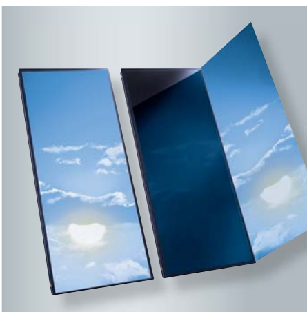
Vitosol 200-FM mit schaltender Absorberschicht ThermProtect