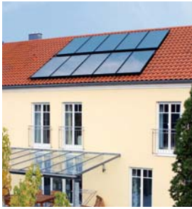
Vitosol 200-FM Zweifamilienhaus Geisenfeld