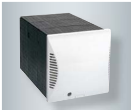
Quadratische Wandhülle mit Außenwandblende

Das kompakte Wohnungslüftungsgerät Vitovent 200-D ist für die kontrollierte Be- und Entlüftung einzelner Räume ausgelegt. Die einströmende Luft wird gefiltert und über den eingebauten Kreuz-Gegenstrom-Wärmetauscher mit der Wärme aus der entzogenen Raumluft erwärmt. Der Wärmerückgewinnungsgrad aus der Abluft beträgt bis zu 90 Prozent. Pro Stunde werden bis zu 55 m 3 Luft ausgetauscht. Beim Einsatz mehrerer Geräte lassen sich vollständige Lüftungskonzepte realisieren.