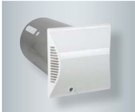
Runde Wandhülle mit Außenwandblende