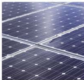
Monokristallines Photovoltaik-Modul Vitovolt 200