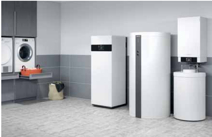
Brennstoffzellen-Gerät Vitovalor PA2 ergänzt die bestehende Gas-Brennwertheizung.

Die Brennstoffzelle Vitovalor PA2 ist die ideale Ergänzung für eine bestehende Heizungsanlage. Mit dem bewährten Gerät erzeugt der Anwender seinen eigenen Strom. Durch den eigenen Verbrauch erzielt der Betreiber einen hohen Autarkiegrad. Er wird weitgehend unabhängig vom öffentlichen Stromnetz und damit auch von steigenden Stromkosten.