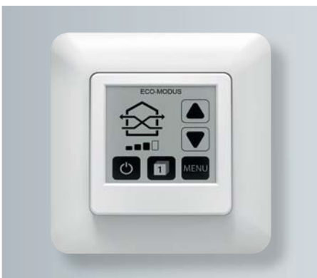
Steuerung mit Touch-Display