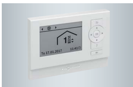
Lüftungsbedienteil, Typ LB1