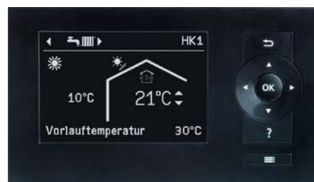
Bedienung von Vitovent 300-C über die Wärmepumpenregelung Vitotronic 200, Typ WO1C